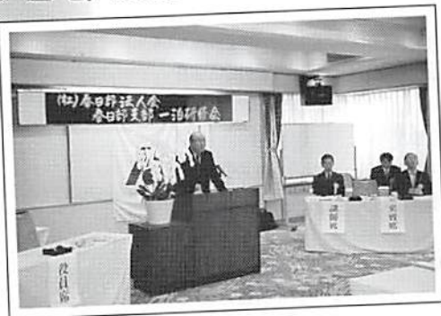
一泊研修会 平成20年2月17日～18日