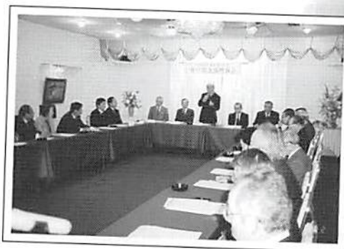
理事会 平成20年1月22日