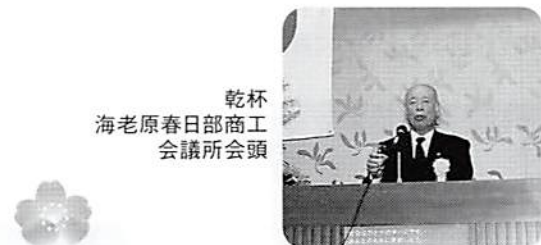
乾杯 海老原春日部商工 会議所会頭