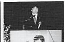
次期開催地発表 川崎岩槻支部部会長