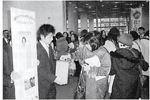
講演終了後、花の引換えと緑のトラスト募金呼びかけ

当日は講演会に先立ち、青年部会員がホール入口で『花と緑 いっぱいの運動』のアピールのため、同運動のチラシと先着400名に花の苗引換券を配布したが、盛況で引換券がまたたく間になくなってしまった。講演終了後、花の引換ととともに「埼玉県緑のトラスト運動」への募金を募った。当日は23,979円の募金が集まった。平成19年度には、各地で行われた産業祭等や公開講座、青年の集い蓮田大会で募った募金が合計201,747円集まり、埼玉県緑のトラスト基金へ寄付する。