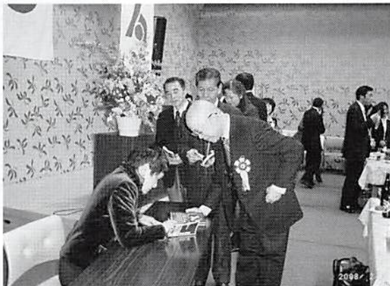
賀詞交歓会でも サイン