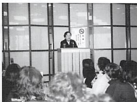
プロデューサー・石井ふく子氏 講演