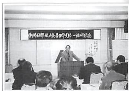
支部一泊研修旅行 平成19年1月25日(木)