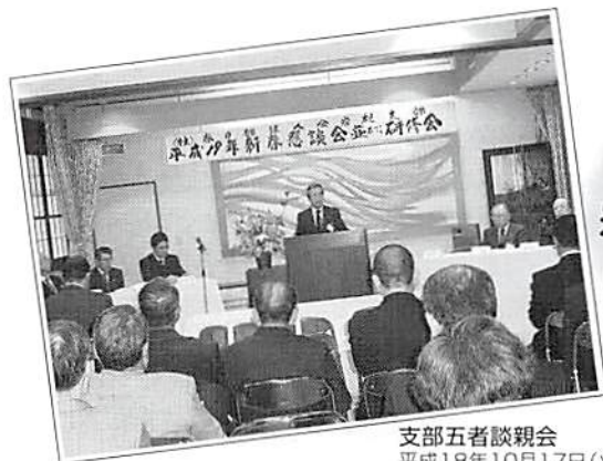
支部五者談親会 平成18年10月17日(火)