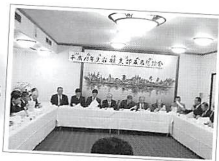
新春懇談会と研修会 平成19年2月13日(火)