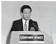
第一講座 古谷審議官