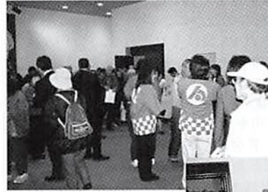
講演終了後、花の引換えと緑のトラスト募金呼びかけ

当日は講演会に先立ち、青年部会員がホール入口で『花と緑いっぱい運動』のアピールのため、同運動のチラシと先着200名に花の苗引換券を配布したが、盛況で引換券がまたたく間になくなってしまった。講演終了後、花の引換えとともに「埼玉県緑のトラスト運動」への募金を募った。当日は15,415円の募金が集まった。平成18年度は各地で行われた産業祭等で募った募金などと合計して、現在220,391円が集まっている。3月に行う青年の集いの時にも募金活動を行う予定であり、それと合計してトラスト募金へ寄付する予定。