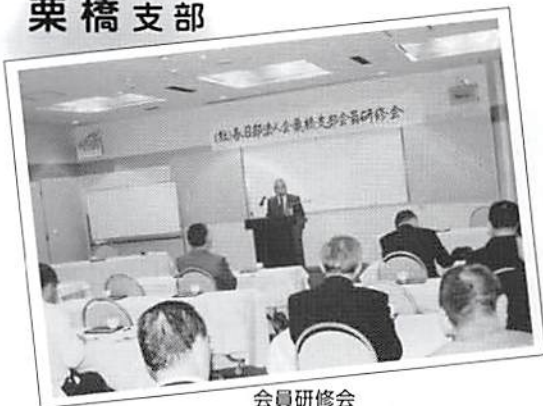
会員研修会 平成19年1月28日(日)・29日(月) 鬼怒川グランドホテル 27名