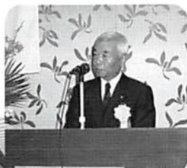
細谷春日部商工会議所会頭