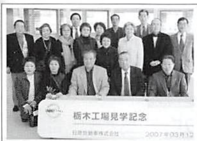
県外研修会 平成19年3月12日(月)