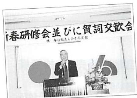
新春後援会並びに賀詞交歓会 平成19年1月26日(金)