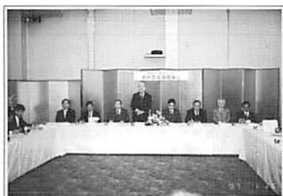
支部理事会 平成19年2月25日(日)・26日(月)