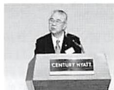
角間全法連税制 委員長