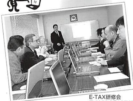
E-TAX研修会 平成19年2月19日(月)