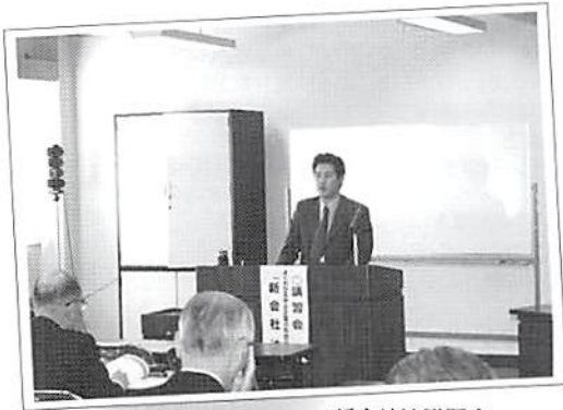
久喜支部 新会社法講習会 平成18年1月19日(木) 場所:久喜市商工会館