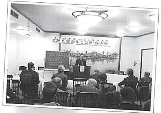
岩槻支部 新春懇談会及び研修会 平成18年2月17・18日