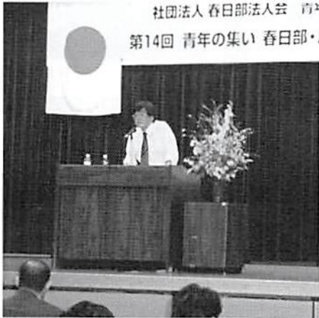
講師クローズアップ

同氏は函館市に生まれ、早稲田大学、読売新聞社に1975年に入社。1983年ワルシャワ特派員を振り出しにブラハ、ワシントン特派員、1995年ニューヨーク支局長を経て1998年大阪支社英字新聞課長。2001年アメリカ総局長として2001年9.11同時テロ等を体験した。2004年1月より現職となったが、長い海外経験に基づき同時テロ以後の米国の社会変化と米国人の「安全」に対する考え方、宗教観等を述べられた。