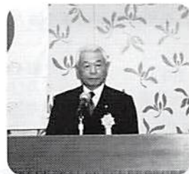
細谷春日部商工 会議所会頭