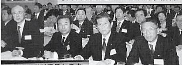
平成18年 税制委員セミナー 財団法人 全国法人会総連合

法人会は税のオピニオンリーダーとして税制委員会を中心とし、来年の税制改正を強力に推進する方針です。