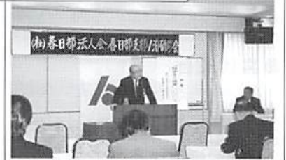
県外研修会 平成18年2月12日(日)