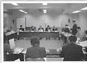
支部役員会 平成17年1月18日(火)