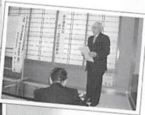
杉戸・宮代支部 杉戸・宮代合同研修会 平成17年2月8日(火)