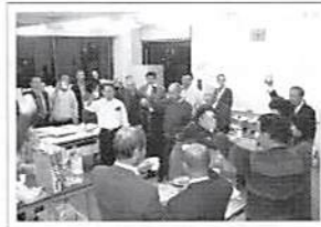
庄和支部 法人会そばまつり 平成16年12月16日(木) 庄和町南公民館 新そば、打ちたて・挽きたて・ 茹でたてを満喫しました。