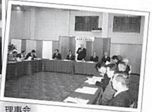
理事会 平成17年1月27日(木)