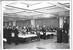
商工会との合同賀詞交歓会 平成17年1月15日(土)