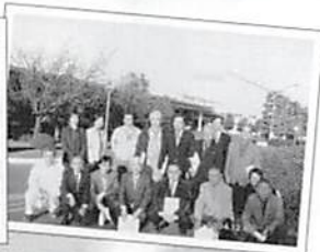
久喜支部 第7会企業見学会 資生堂久喜工場 平成16年12月2日(木)