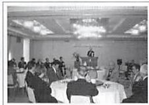
白岡支部 新年賀詞交歓会 平成17年1月28日(金)