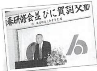
幸手支部 新春研修会・賀詞交歓会 平成17年1月27日(木)