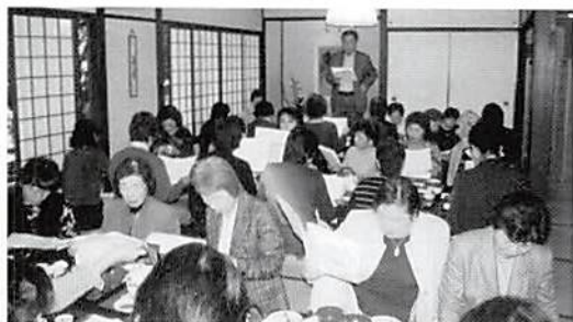
▲鎌倉シルバーボランティアガイド協会 政尾会長より講義