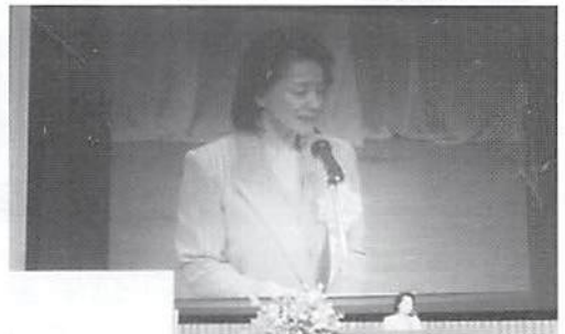
講師:ジャーナリスト 櫻井よしこ氏 テーマ「世界の中の日本」