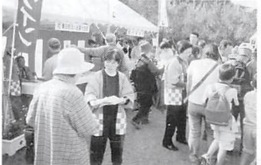
宮代産業祭 H.16.11.7(日) 新しい村