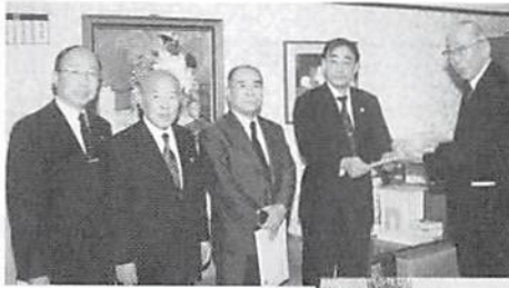
◀ 右から長野税制委員長（政府税調特別委員）、福田主税局長、仁上税制小委員長、白銀税制小委員長代理、若泉全法連専務理事