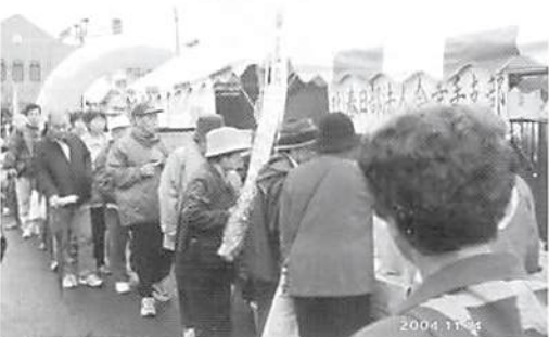
幸手市民まつり H.16.11.14(日) 東さくら通り 緑のトラスト募金実施 10,505円