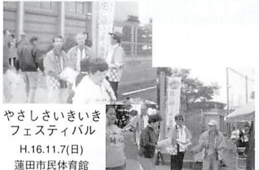
やさしいいきいき フェスティバル H.16.11.7(日) 蓮田市民体育館