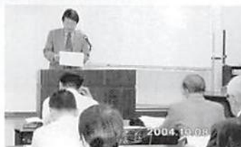
H16年度第3回理事会及び税務研修会 H.16.10.8 久喜商工会館