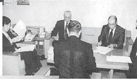
左から加藤審議官、長野税制委員長、若泉全法連専務理事（後ろ向き）、仁上税制小委員長、白銀税制小委員長代理