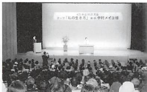
商工会議所 青年会議所との合同講演会 於 岩槻イグレッタ大ホール H.16.10.18 中村メイコ氏「私の生き方」