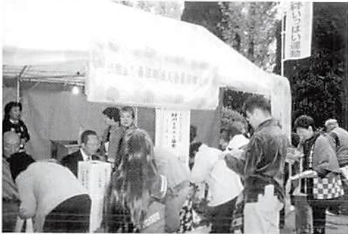
春日部商工まつり H.16.11.13(土)~14(日) 大沼運動公園