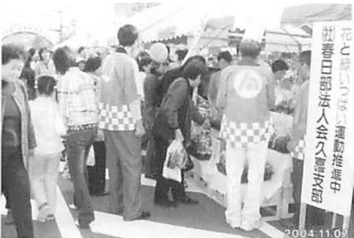
第18回久喜市民まつり H.16.11.7(日) 久喜駅前通り