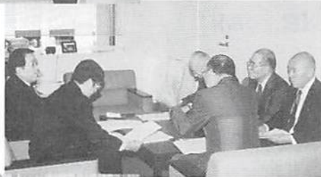
左から板倉局長、小室審議官、長野税制委員長、若泉専務理事（後ろ向き）、仁上税制小委員長、白銀税制小委員長代理