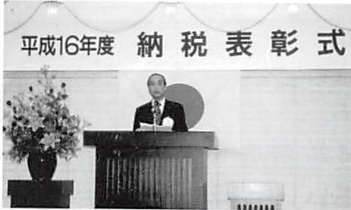
高木署長あいさつ