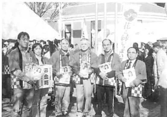
商工祭 H16.11.21(日) 栗橋町イリス