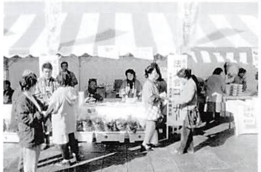
岩槻市産業祭 H.16.11.20(土)~21(日) 槻の森スポーツセンター