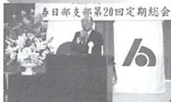
▶ H16.5.14(金) 春日部支部総会