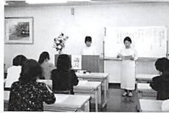
H16.5.10(月) ▶ 女性部会総会 (宮代商工会館)