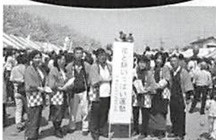
H16.4.3(土) さくら祭り 「花と緑いっぱい」運動