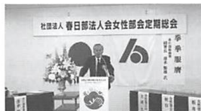
清水副署長 講演 「 けんけんふくよう 拳々服膺」