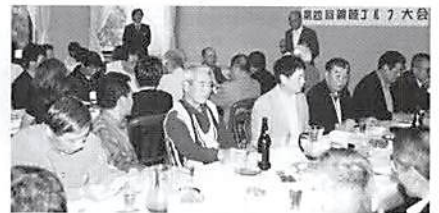
▲ H16.4.7(水) 第4回親睦ゴルフ大会 於：都賀C C