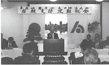
H16.5.18(火) 岩槻支部総会 (於:ほてい家)