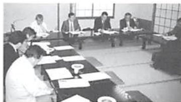
◀ H16.5.7(金) 青年部会総会