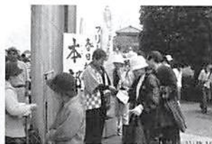
H16.4.11(日) 花と緑の祭典「花と緑いっぱい運動」