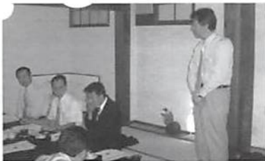
H16.5.11(火) 青年部会総会 (於:旬菜)