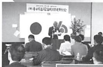
◀ H16.5.24(月) 第21回定期総会