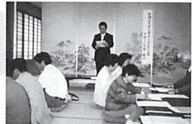
▲ H16.5.20(木) 宮代支部総会