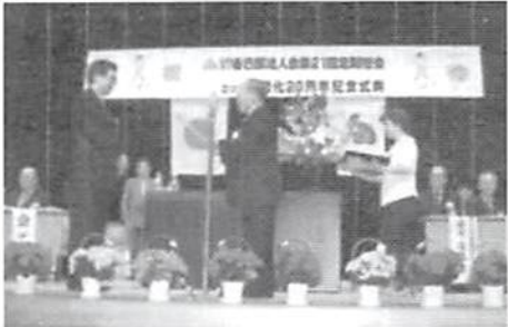
▲会員増強表彰 埼玉りそな銀行 岩槻支店長へ