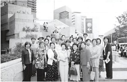
女性部会研修 六本木ヒルズ前にて H15.6.26