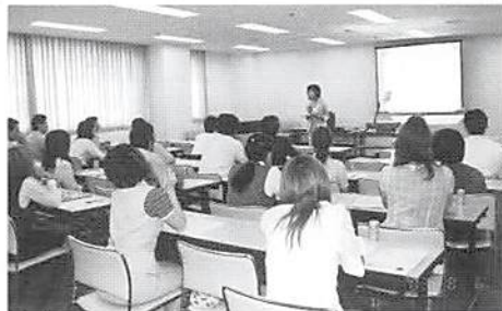
受講風景 実践の確認