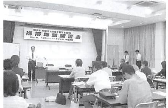
女性部会・青年部会 合同講習会 H15.7.23 於 鷺宮町商工会館