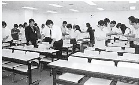
名刺の受け方・渡し方

会員企業の成長には人材育成が欠かせません。社員の対応は、企業のイメージを大きく左右します。職場で一般的に行われているマナーについて自分の行動を振り返り、電話対応、来客対応、お茶の出し方、上座下座の関係、等を実践しました。出席者には組織人としての役割を再確認してもらいました。