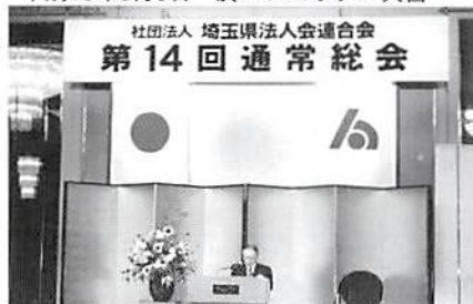
吉野県連会長あいさつ

関東信越国税局、浦和税務署、埼玉県をはじめ多数のご来賓にご臨席いただき、盛大に開催されました。