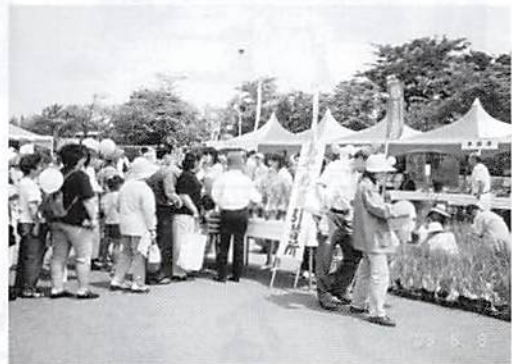
H.15.6.8(日) あやめ祭り参加 あやめの苗1000株配布