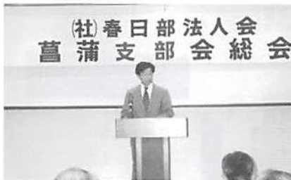
来賓挨拶 菖蒲町桜井助役 H.15.5.26(月)