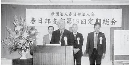
H.15.5.19(月) 正副支部長あいさつ