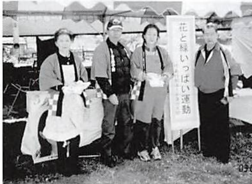
H.15.4.6(日) 商工会「さくらまつり」に参加 花と緑いっぱい運動展開中