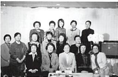
女性部会 新春食事会 H.15.2.13 於・ホテル久喜