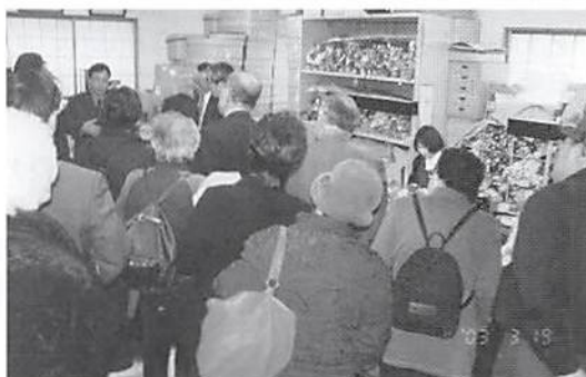
人形工房にて 職人が人形を製作中