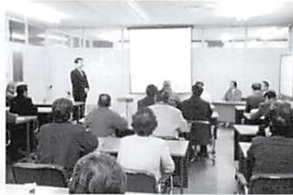
「一泊研修会」H.15.2.24 蓮田支部では「独自技術を有し環境に対する有益な活動を展開している(ISO14001認証取得)企業の視察研修」というテーマで(株)ヨコオ富岡工場を視察しました。 研修参加者34名