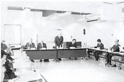
平成14年第6回支部役員会 H.15.3.19 於・久喜市商工会館