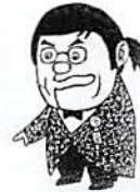
綾小路きみまろ氏 芸歴☆

なお、当日はフジテレビの収録があり、3月15日午後2時より「広告大賞」と言う番組の中で放映され、春日部法人会が全国に紹介された。