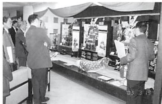
端午の節句用 鎧・兜展示販売中

節句人形の製造、卸、販売。日本一の人形生産地、岩槻市の中でも、創業150年を誇る老舗中の老舗。二つの工房を持つほか、市内外の職人、工房と協力しながら人形を制作し、全国約500社に卸している。