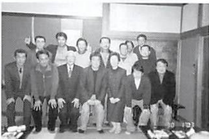
青年部会 新年会 H.15.1.30 於・魚庄