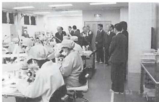
携帯電話の部品組立中