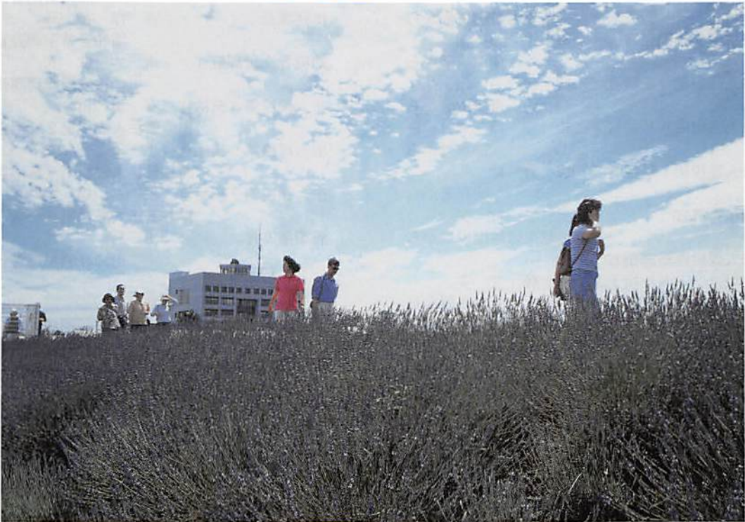
菖蒲町「あやめ・ラベンダーの里」

春日部市大字樋堀 369-4 春日部市商工会館内 T E L 048 (761) 3551 F A X 048 (752) 8244