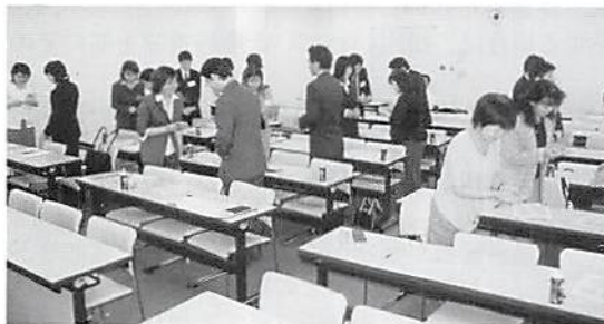
名刺の受け方・渡し方

会員企業の成長には人材育成が欠かせません。社員の対応は、企業のイメージを大きく左右します。職場で一般的に行なわれているマナーについて自分の行動を振り返り、電話対応、来客対応、お茶の出し方、上座下座の関係、等を実践しました。出席者には組織人としての役割を再認識してもらいました。