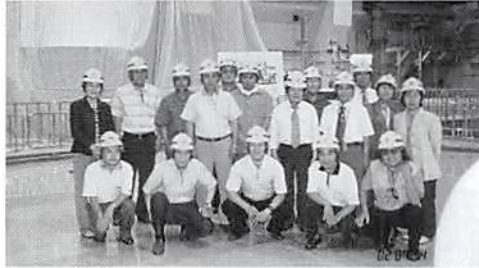
柏崎刈羽原子力発電所にて