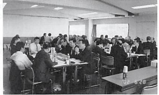
各委員会に分れて討議

平成14年5月28日に行なわれた総会を受けて、今年度第1回理事会を開催、以下の議案を承認した。