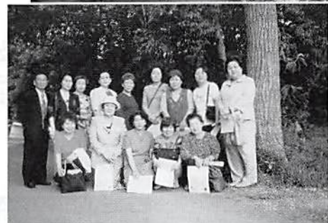
緑のトラスト保全第5号地 「山崎山の雑木林」にて