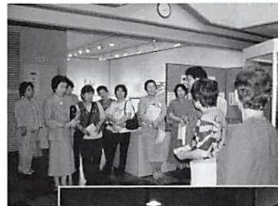
◀ 旧加藤家住宅にて 宮代町郷土資料館にて

緑のトラスト運動は、埼玉県内の優れた自然や貴重な歴史的環境を、県民共有の財産として末長く保全していこうという運動で、宮代町の山崎山が保全第5号地として指定され、整備が進められています。