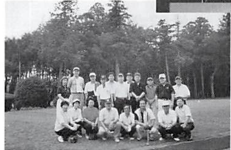
第一部 10周年記念ゴルフコンペ 於 千葉カントリークラブ