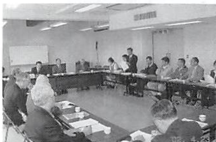
平成14年度第1回役員会 H14. 4. 3 於 久喜市商工会館