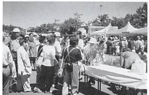
菖蒲町あやめまつりに参加 H14. 6. 9 (日) あやめの苗1000株配布 (於 菖蒲町役場前)