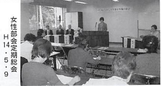
女性部会定期総会 H14. 5. 9