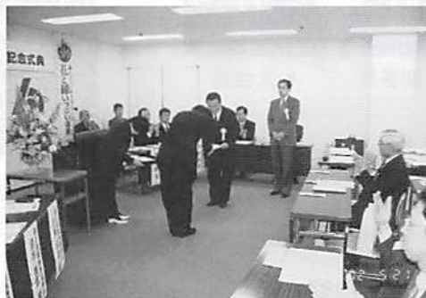
歴代部会長へ 感謝状贈呈