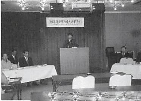
定期総会 H14. 5. 9