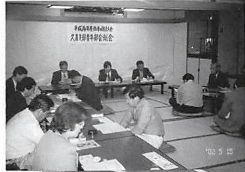
青年部会総会 H14. 5. 15