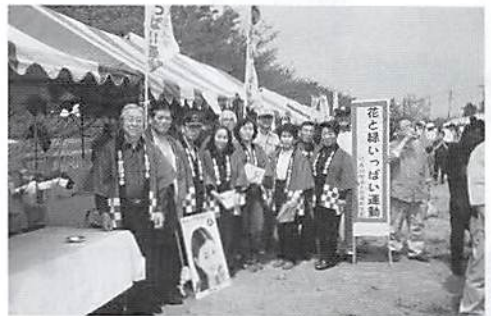
H14. 4. 6 商工祭「さくら祭り」参加