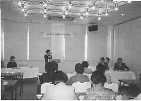
女性部会総会 H14. 5. 2