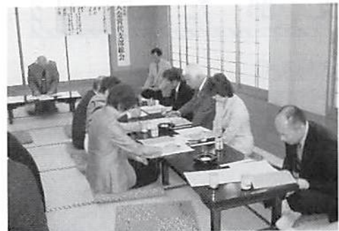
定期総会 H14. 5. 24