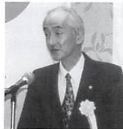
寺田春日部県税事務所▲ 課税部長