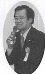
司会 染谷10周年準備 委員長