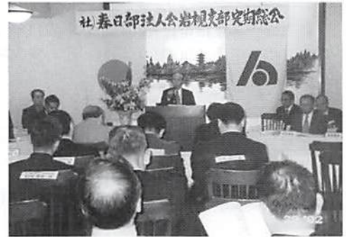
定期総会 H14. 5. 20