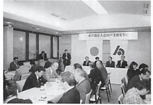
定期総会 H14. 5. 17