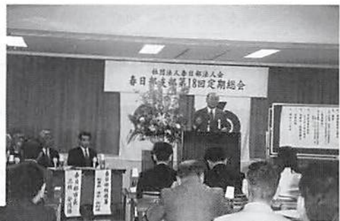
定期総会 H14. 5. 23