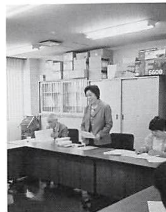
女性部会総会 H14. 5. 10