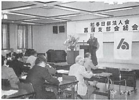
定期総会 H14. 5. 24