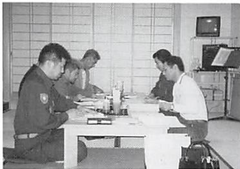
青年部総会 H14. 5. 16