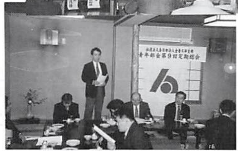
青年部会総会 H14. 5. 16