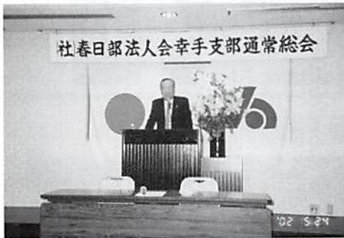
通常総会 H14. 5. 24