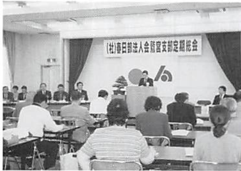
定期総会 H14. 5. 23