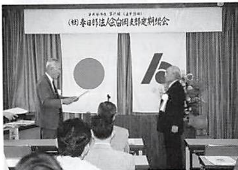
定期総会 H. 14. 5. 27 於 白岡町商工会館