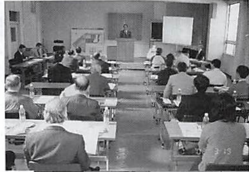
◀ 臺研修委員長あいさつ