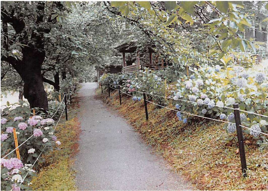
幸手市「権現堂堤のアジサイ」

春日部市大字樋堀 369-4 春日部市商工会館内 T E L 048(761)3551 F A X 048(752)8244