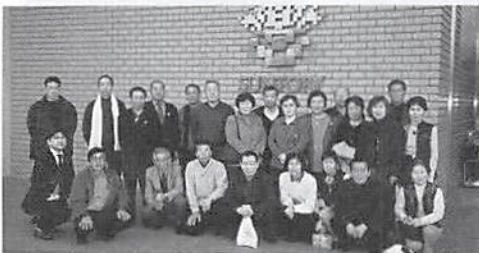
県外研修会 H14. 2. 25 「サントリー利根川ビール工場にて」