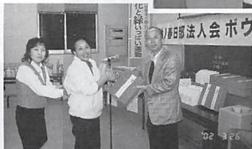
優勝 三上牧場チーム