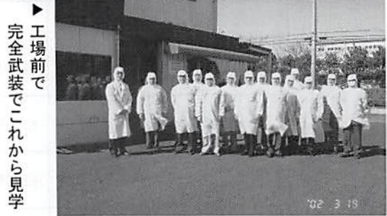
▶ 工場前で完全武装でこれから見学