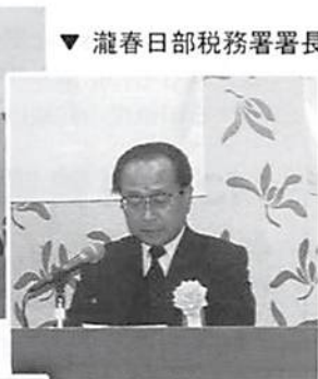
▼ 瀧春日部税務署署長