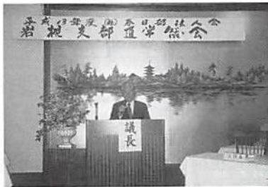
H. 13. 5. 24 (木)