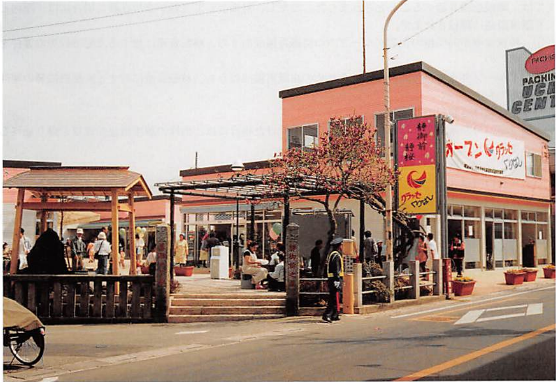
栗橋町「クラッセくりはし」

社団法人 春日部法人会 春日部市大字樋堀 369-4 春日部市商工会館内 T E L 048(761)3551 F A X 048(752)8244