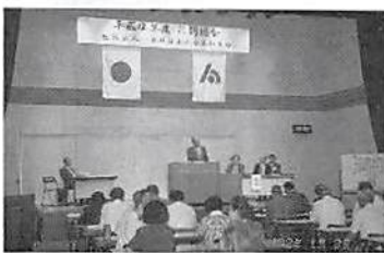
▲ 庄和支部総会 H. 12. 6. 21 於