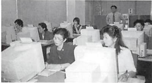
真剣な眼差しで受講された女性部会会員

(1)インターネットの概要・(2)インターネット体験・(3)電子メールの送信と受信等の内容を1回2時間づつ2回受講します。19名参加申込みされましたが、「心に大きな希望と新たな夢が湧いて来た」「次回の受講が今から楽しみだ」との声が多く聞かれました。