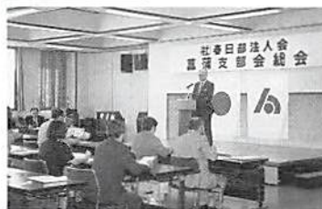
◀ 菖蒲支部総会 H. 12. 6. 16 於 あやめ会館 (商工会館)