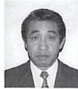
春日部税務署副署長（法酒担）