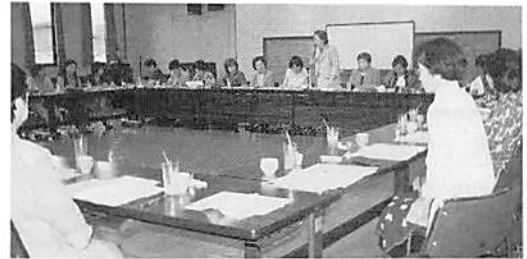
各委員会に 別れて討議 組織委員会