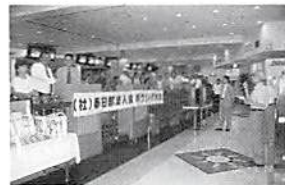
河津厚生委員長 あいさつ

全員にもれなく参加賞を進呈し、楽しい一時を終了しました。次回も是非積極的にエントリーして頂きますようお願い致します。