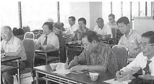
H12. 7. 9 東急ホテル会議室

城ヶ島京急ホテル会議室において、あさひ銀行鷺宮支店長を講師に迎え「IT革命の現状について」講演会を開催いたしました。又、翌日は、NTTサイバーコミュニケーションを視察研修し、情報流通社会に向けたNTTの研究開発を、直接体験することが出来、非常に有意義な研修会でした。