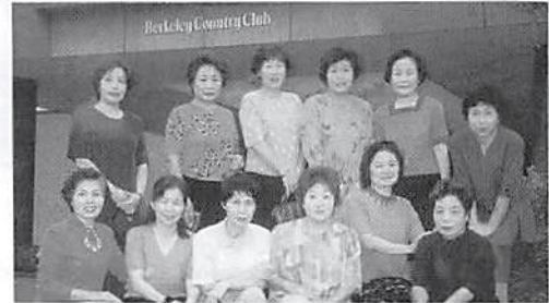
▲前列左より3番目が私です 女性部会ゴルフコンペにて