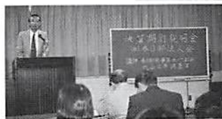
春日部会場 春日部税務署 丸山上席調査官