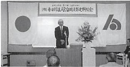
H. 12. 5. 29 (月) 於 白岡町コミュニティセンター