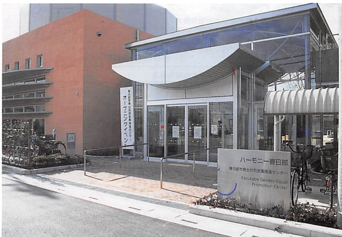
春日部市男女共同参画推進センター「ハーモニー春日部」

春日部市大字樋堀 369-4 春日部市商工会館内 T E L 048(761)3551 F A X 048(752)8244