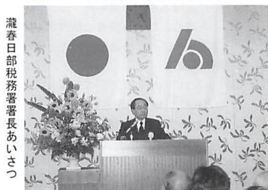
瀧春日部税務署署長あいさつ