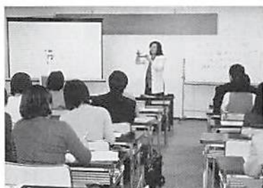
お茶を出す時の注意

又、この研修で使用したビデオを始め、その他のビデオも貸出も致しますので、是非社内研修等でご利用下さい。