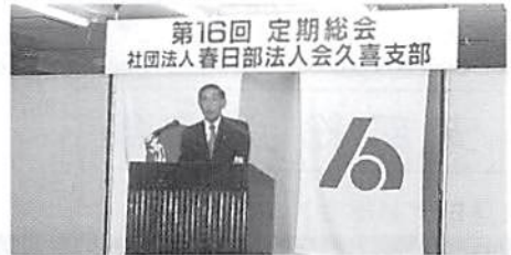
H. 12. 6. 2 (金) 於 三高サロン会議室