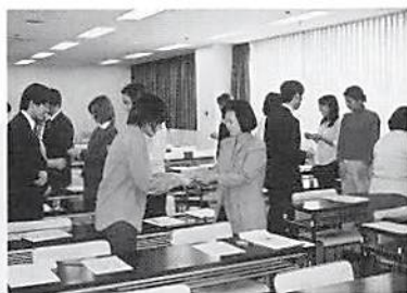
名刺の受け方・渡し方