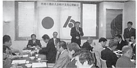
H. 12. 5. 27 (土) 於 和泉屋会議室