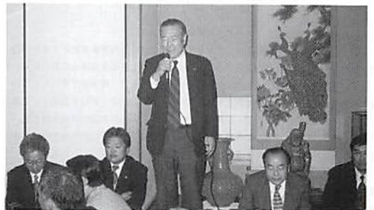
高浜副会長（幸手支部長）あいさつ