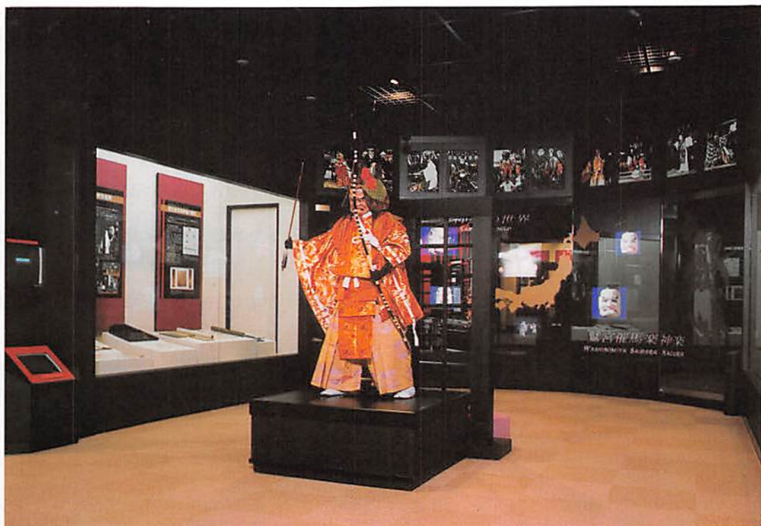
鷺宮町立郷土資料館 神楽展示コーナー

春日部市大字樋堀 369-4 春日部商工会館内 T E L 048(761)3551 F A X 048(752)8244