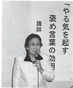
土屋女性部会長あいさつ

第二部の懇親会では、第一部で学んだ褒め言葉の効用を実践し、大変盛況となりました。