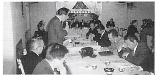
H12.1.24 春日部支部理事会 (会員増強促進会議)