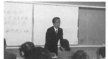
▲春日部税務署丸山上席調査官 (久喜会場にて)