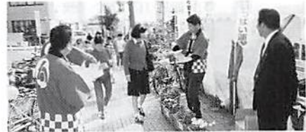
H11. 10. 24 宮代産業祭