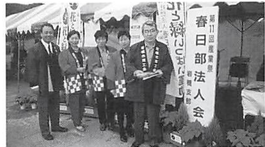
H11. 11. 20~21 岩槻産業祭