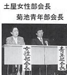
土屋女性部会長 菊池青年部会長