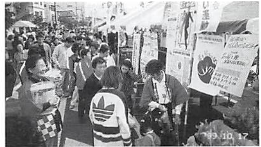
H11. 10. 17(日) 第13回久喜市市民まつり 法人会PR活動(クイズチラシ配布・花の種と苗の配布・ビデオ放映)