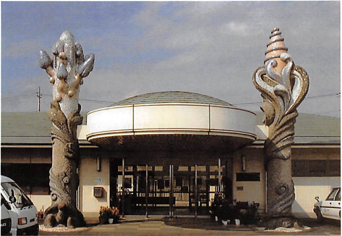
特別養護老人ホーム「しょうぶ苑」正面玄関モニュメント

春日部市大字樋堀 369-4 春日部市商工会館内 T E L 048(761)3551 F A X 048(752)8244