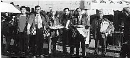
H11. 11. 21 栗橋商工まつり