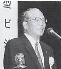
松永会長あいさつ