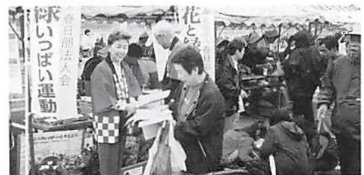
H11. 11. 7(日) 農業祭