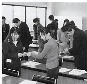
名刺の受け方、渡し方