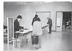
←受付風景 蓮田会場