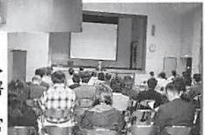
▶ 春日部税務署 高野法人 第二統括官