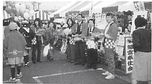
H11. 11. 7 商工祭