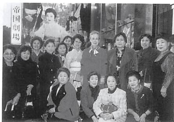
劇場前にて(参加者有志)

劇中には、全国各地の代表的な女将が実際に出演し大変な盛り上がりを見せ、参加者は女性経営者として大いに研鑽になった。