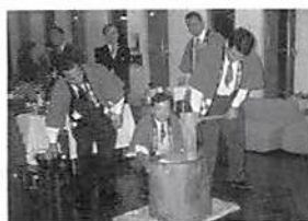
第三部 餅つきで歓迎

又、当法人会の社会貢献運動「花と緑いっぱい運動」と関連して、埼玉県で推進している「さいたま緑のトラスト基金」を募り、21,969円を同基金に寄付を行った。