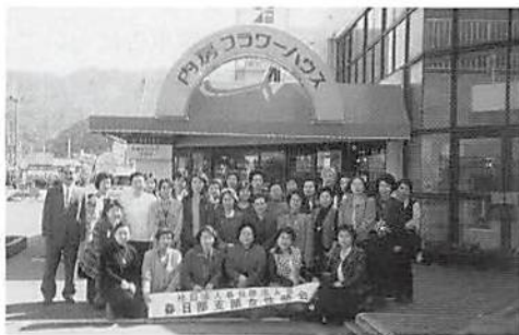
H11. 3. 2 女性部会県外研修会実施