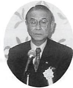
鹿間春日部商工会議所会頭