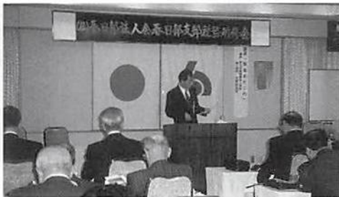
H11. 3. 17 税務研修会実施