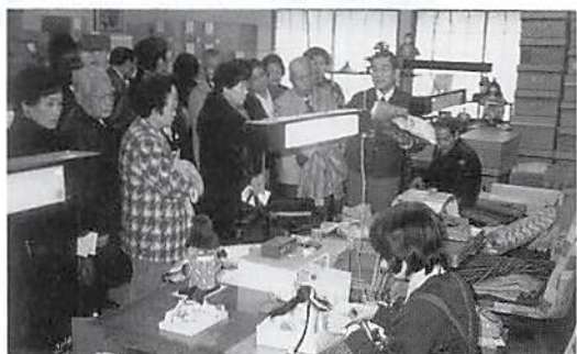
「東玉人形会館」にて