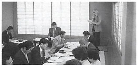
H10. 6. 15 宮代支部総会