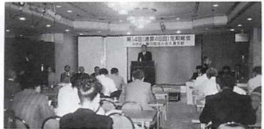
H10. 6. 24 久喜支部総会