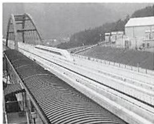
▼ 山梨県リニア見学センターにて