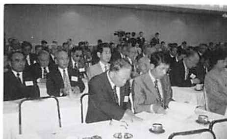
◀ 県連総会出席の皆様