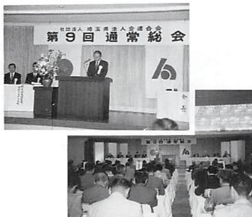
H10. 6. 2 県連総会風景▲

なお総会に先立ち表彰式があり、当春日部法人会からは次の方々を受章されました。おめでとうございます。