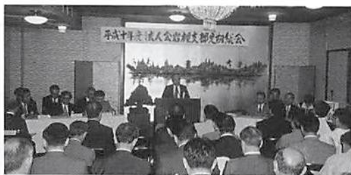
H10. 6. 29 岩槻支部総会