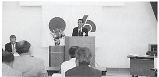
H10. 5. 20 鷺宮支部総会