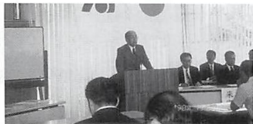
H10. 7. 23 庄和支部 総会