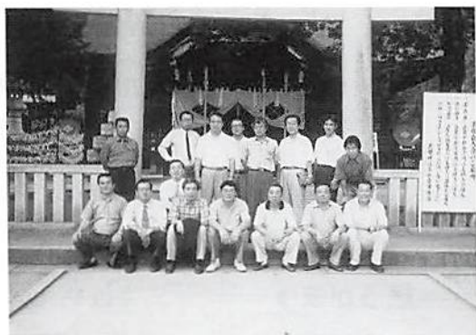
▲ 甲府武田神社に参拝

バス車中では、法人会のビデオライブラリーより経営を中心としたビデオ11巻を持ち込み、内容の濃い有意義な研修旅行となった。