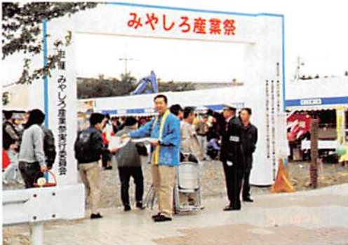
宮代産業祭 H9. 10. 26