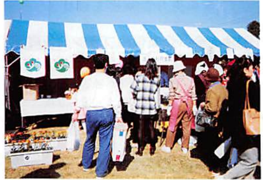
杉戸産業祭 H9. 11. 2