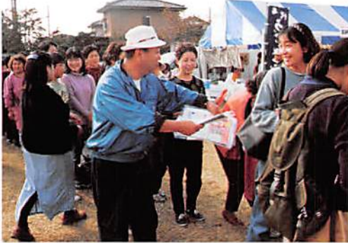
菖蒲産業祭 H9. 11. 3