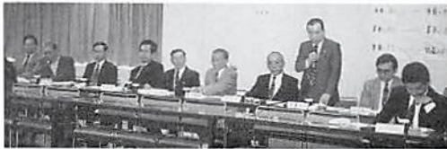
尾堤組織副委員長発言