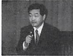
和田副署長あいさつ