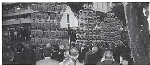
秋田竿燈祭での歓迎