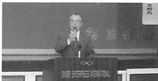
前田会長あいさつ