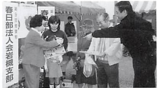
資料を手渡す青年部会・女性部会員

に、岩槻支部及び青年部会、女性部会がそれぞれ力を合わせ、税務知識のパンフレットと花の種3,000部を配布、大変喜ばれました。この種が不透明な日本経済の流れを変える明るい一輪の花として開花してくれることを願います。