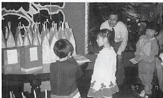
ビンゴゲーム賞品 「どれがいいかな?」

今回は、青年部会員とその家族を対象とした企画で、ご来賓の皆様や小さいお子さまも含めて総勢40名ほどになり大変にぎやかな懇親パーティーとなりました。