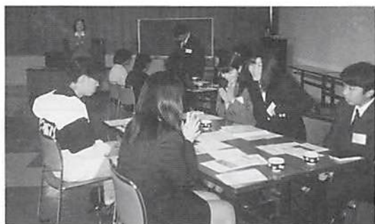
受講の皆様 グループ実習

この研修会は昨年に続き2回目の研修会ですが、当日は新人を中心に23名の参加を頂きました。