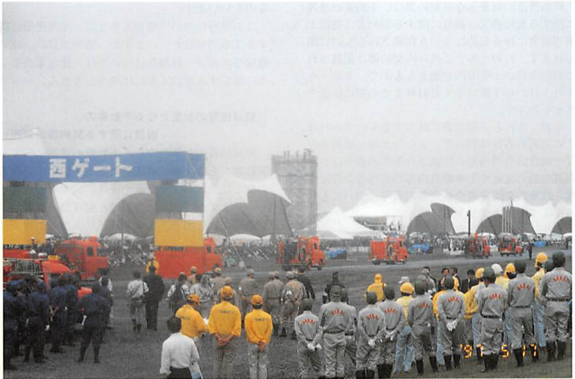
カスリーン台風50年第46回利根川水系連合水防演習 (H9.5.17)

春日部市大字樋堀 369-4 春日部商工会館内 TEL 048(761)3551 FAX 048(752)8244