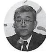
福田埼玉県連専務理事