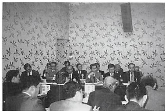
ご 来 賓 席