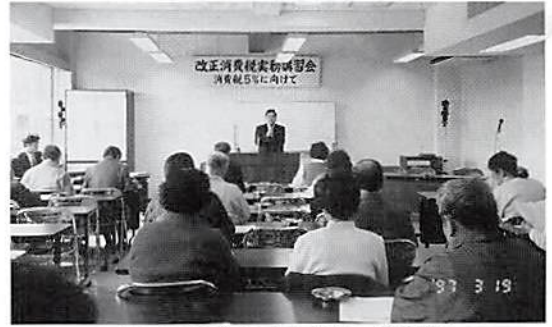
春日部税務署 戸田第4統括官

消費税法の一部が改正され、平成9年4月1日より施行されるのに先立ち、3月19日(木)の午前10時よりと、午後1時30分よりの2回に分けて「改正消費税実務講習会」が開催され、盛況のうちに終了致しました。これは、(社)春日部法人会久喜地区会が音頭をとって、久喜市商工会、久喜市青色申告会、春日部間税会、そして春日部税務署の御理解、御協力のもと主催させて頂き、関東信越税理士会春日部支部の講師派遣の御協力を頂いて、久喜商工会2階の会議室にて開催したものです。