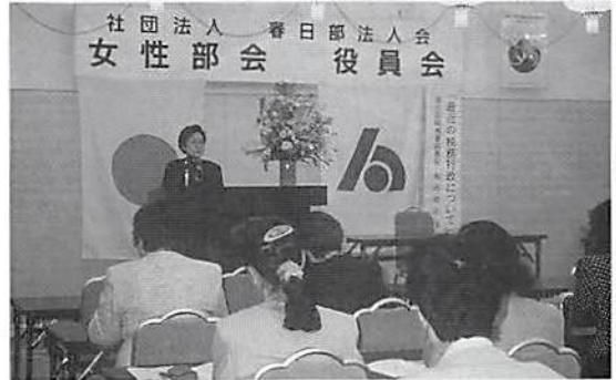
岩谷部会長あいさつ