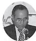
草間春日部税務署長