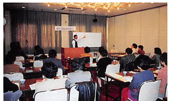
蓮田地区会女性部会税務研修会 H9.2.19 春日部税務署 戸田第四統括官 「消費税・税務と経理の対応策」