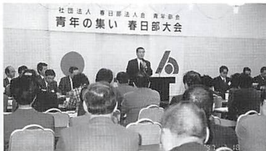
多ヶ谷青年部会長あいさつ