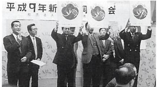
青年部会による地域社会貢献運動発表 「花と緑いっぱい運動」