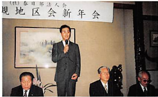
岩槻地区会 新年会 H9.2.13 春日部税務署 神代第一統括官