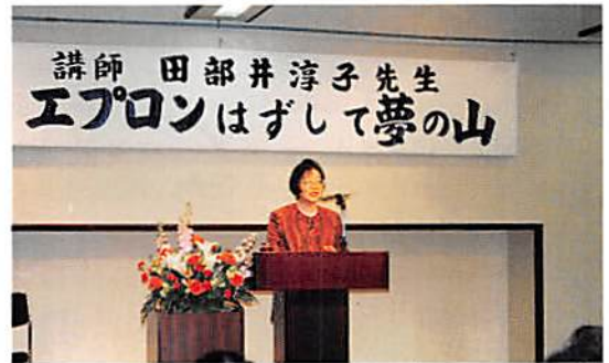
菫蒲地区会 新春講演会 H9.2.8 於・あやめ会館