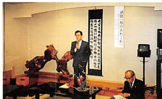
宮代地区会新春講演会 H9.2.12 講師・春日部税務署神代第一統括官 テーマ「税のあれこれ」