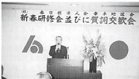
前田地区会長あいさつ

研修後、会員及び来賓合わせて60名による賀詞交歓会が行われ、和やかなうちに交流がつつげられました。