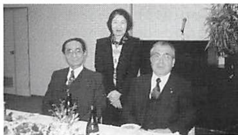
奈良幸手市 秋谷幸手地区 前田幸手地区 商工会長 女性部会長 会長

懇親会では、ジャンケンゲームで今年の運だめしをしたり、今世界中で流行のマカレナのリズム