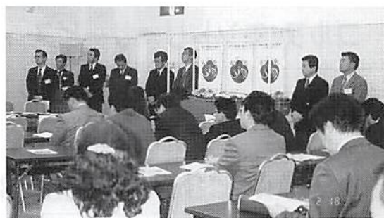
「花と緑いっぱい運動」発表 社会貢献特別委員会メンバー