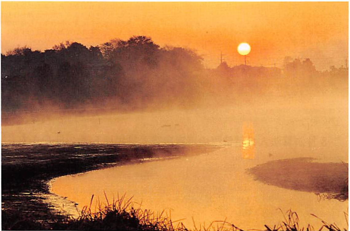
湖面にゆったりと朝もやが立ちこめる黒浜沼

春日部市大字樋堀 369-4 春日部商工会館内 TEL 048(761)3551 FAX 048(752)8244