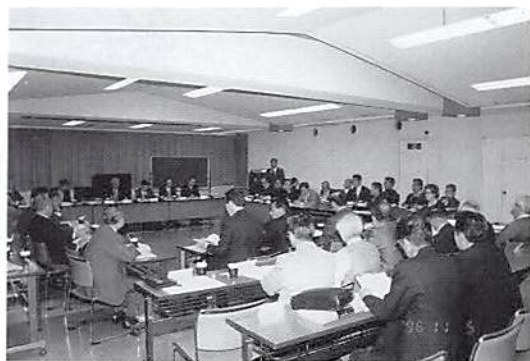
多ヶ谷青年部会長報告