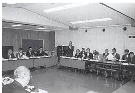
染谷総務委員長報告