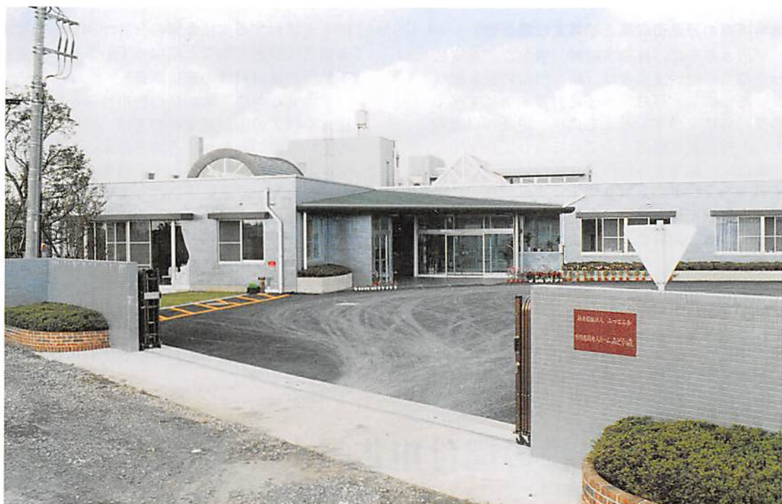
宮代町 特別養護老人ホーム「みどりの森」

春日部市大字樋堀 369-4 春日部商工会館内 TEL 048(761)3551 FAX 048(752)8244