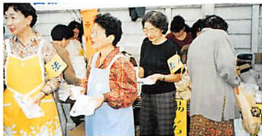
商工まつりで活動する女性部のみなさん

今回は第1回目の活動で準備不足もありましたが、これを契機に「地域社会貢献運動」の輪が徐々に広がることが期待されます。