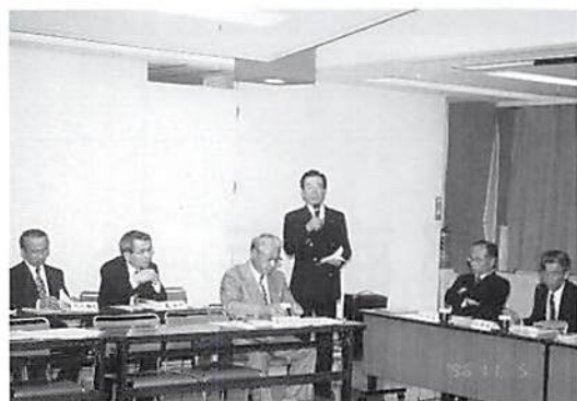
竹之内税制委員長報告