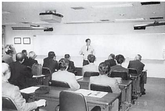
富士ゼロックス研修会場

大企業の経営管理に、見学者それぞれが得たものは大変有意義であろうと思われる見学会であった。