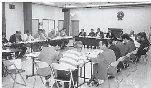
幸手地区会役員会