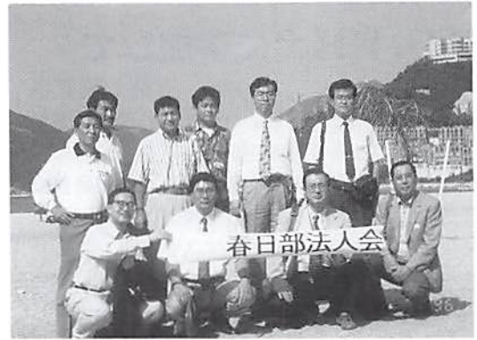
香港レパルスベイにて

自由奔放な経済については、返還後についても劇的な変化はなさそうとの見通しです。おそらく数年後に香港を訪れてもビクトリアピークから見る夜景のすばらしさとデューティフリーショップを訪れる日本人の数は変わらないことでしょう。