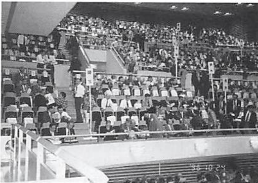
埼玉県連席3階 休憩時間

第14回全国大会が静岡県浜松市内のアクトシティー浜松で開かれ、当法人会よりも会長以下3名が出席した。➤