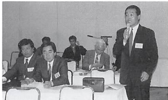
多ヶ谷青年部会長の発表