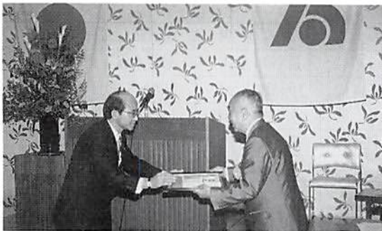
大同生命より感謝状、目録受領