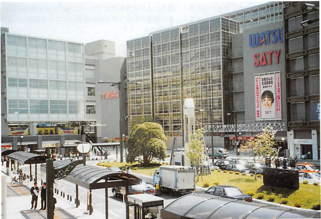
岩槻市の表玄関完成

春日部市大字樋堀 369-4 春日部商工会館内 TEL 048(761)3551 FAX 048(752)8244