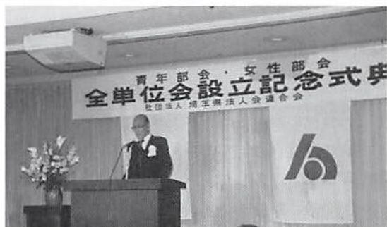
伊地知県連会長あいさつ

各単位会の友好を深めると共に今後のさらなる活躍を確認し合うすばらしい場となりました。