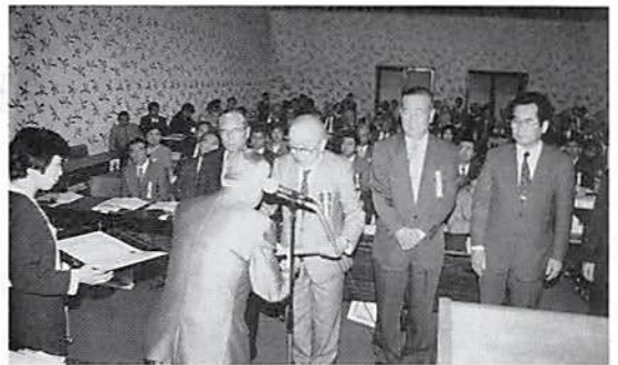
法人会長表彰状贈呈