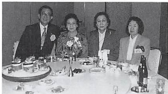
服部全法連 岩谷 土屋 秋谷 事務局長 部会長 副部会長 副部会長