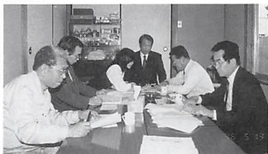
地区会監査 杉戸町商工会館にて

杉戸地区会では5月13日(月)役員会が開催され、それに先だって業務並びに会計について監査が行われた。これは地区総会の提出議案の検討と言うことで十分な審議が行われて、杉戸地区会の定期総会は5月27日と決定された。(砂川祐亮記)