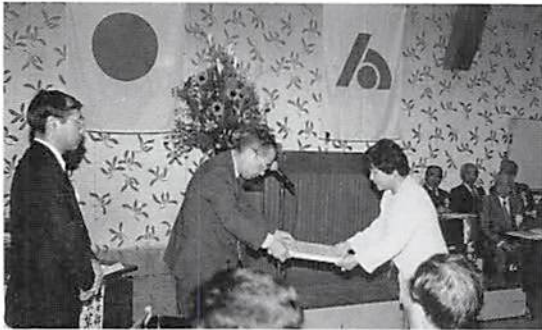
税務署長感謝状贈呈