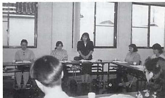
柿沼地区会女性部会長あいさつ