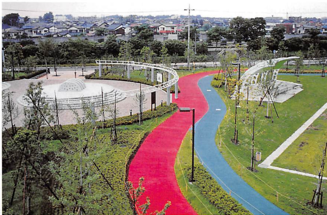
白岡町「ふれあいの森公園」

春日部市大字樋堀 369-4 春日部商工会館内 TEL 048(761)3551 FAX 048(752)8244