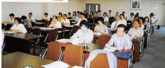
春日部税務署3階大会議室