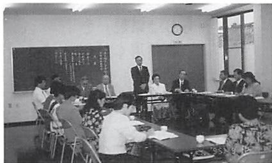
川上副署長あいさつ