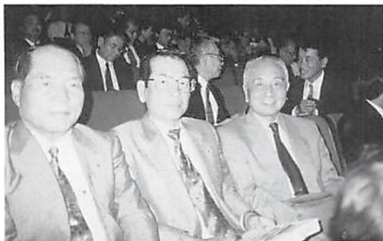
右から齋藤会長、竹ノ内税制委員長、石井事務局長