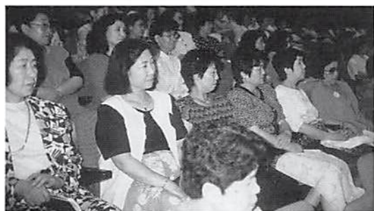
聴講の女性部会員