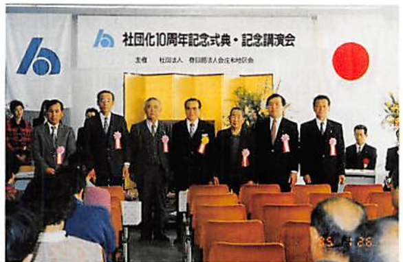
感謝状を受賞した功労者の方々