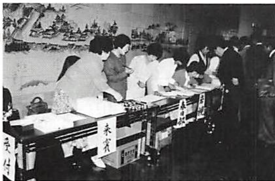
会 場 受 付