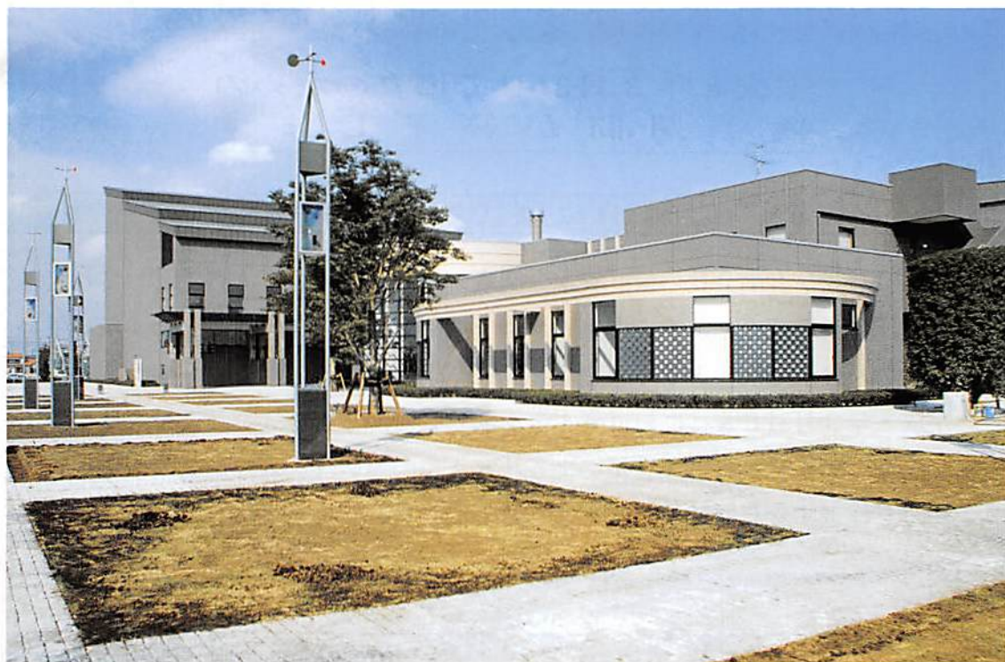
栗橋町総合文化会館「イリス」

春日部市大字樋堀 369-4 春日部商工会館内 TEL 048(761)3551 FAX 048(752)8244