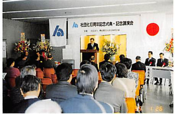
地区会10周年記念式典