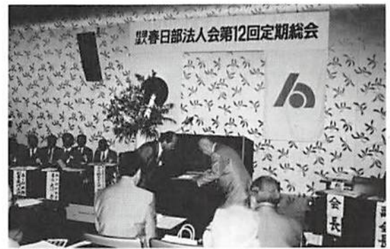
大同生命から感謝状及び推進協力金の贈呈